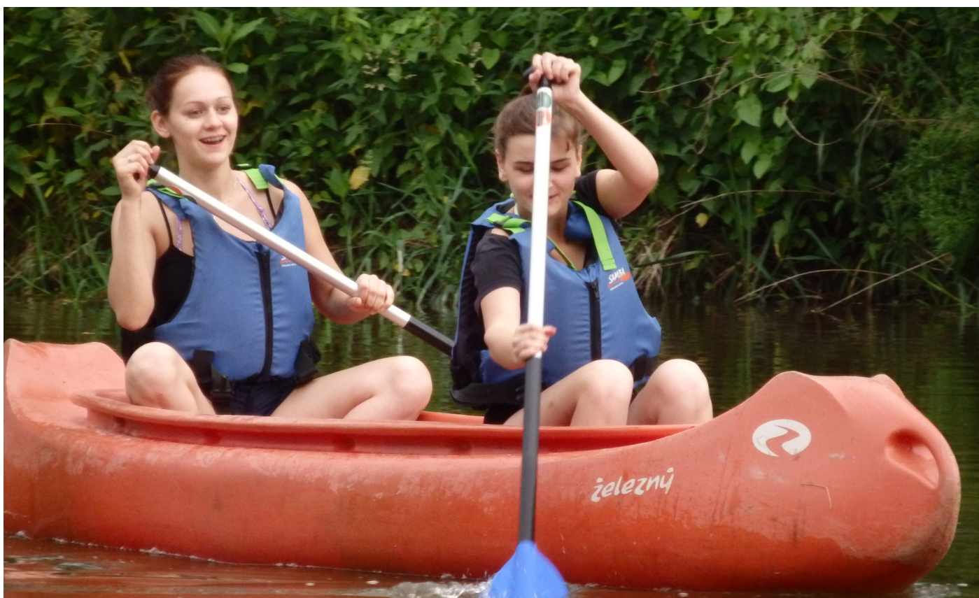
Obrázek č. 5: Turistický kurz třídy E3