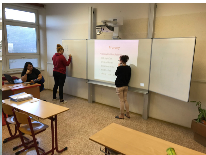
Obrázek č. 11: využití interaktivní techniky ve výuce