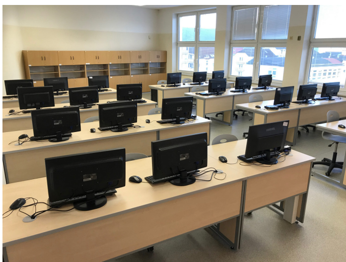
Obrázek č. 8: nově zrekonstruovaná učebna IKT

Škola má vlastní jídelnu v budově sousední základní školy, bezbariérový přístup do jídelny je zajištěn podchodem. Během dopoledne mají žáci k dispozici bufet a automat s teplými nápoji.