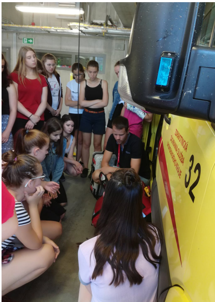
Obrázek č. 17: Exkurze - ZZS Bohunice