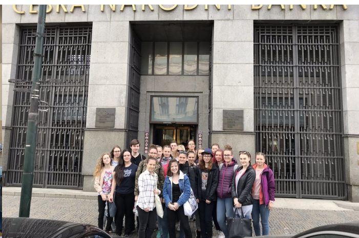
Obrázek č. 23: Exkurze do ČNB