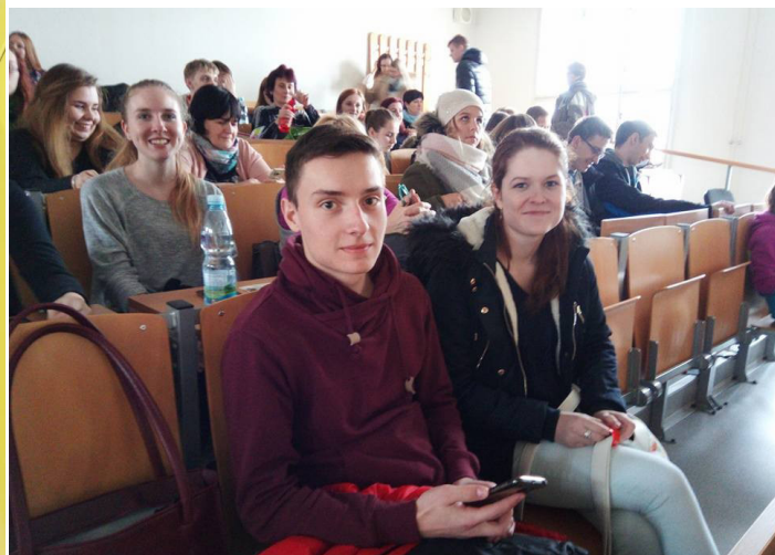
Obrázek č. 19: Celostátní soutěž v účetnictví ve Znojme