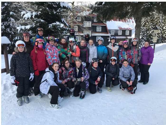
Obrázek č. 3: LVK Deštné v Orlických horách