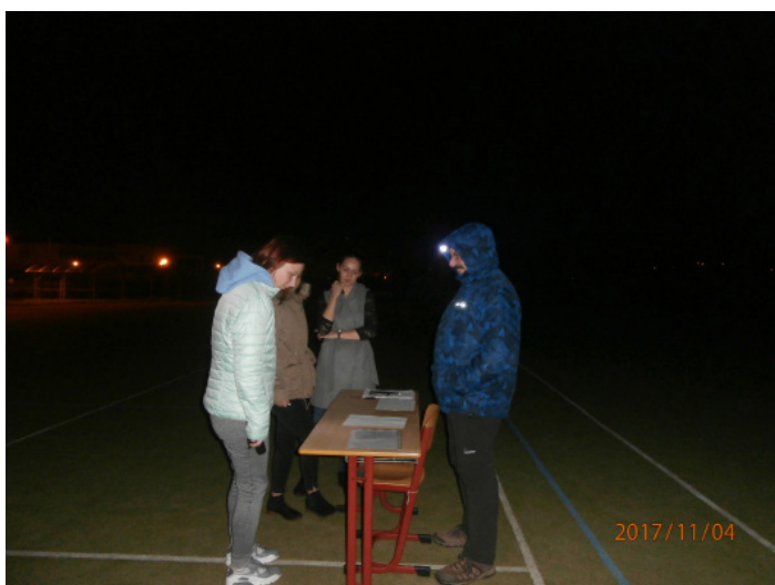
Obrázek č. 6: Noční hlavolámání