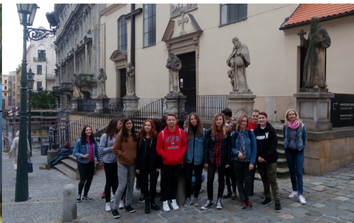
Obrázek č. 18: Exkurze ke kapucínům a na Špilberk