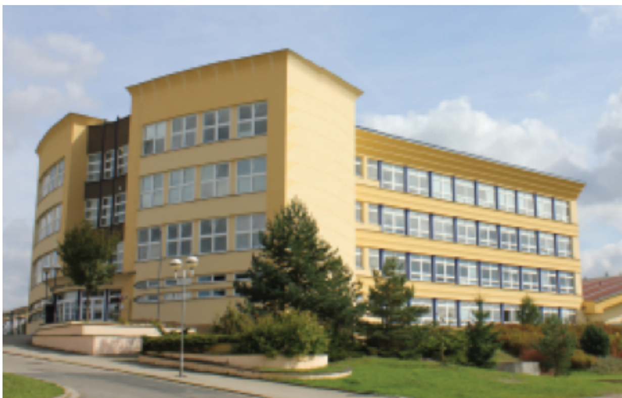
Obrázek č. 1: budova školy