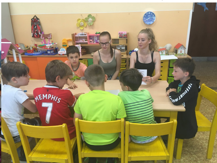
Obrázek č. 21: Den zdraví na ZŠ Salmova