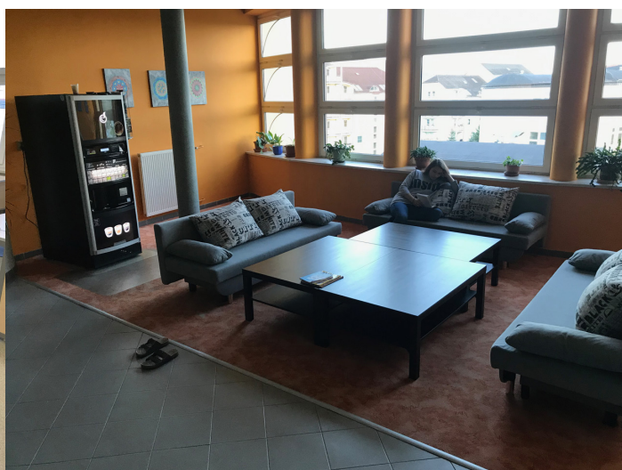
Obrázek č. 9: relaxační centrum