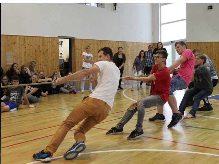
Obrázek č. 7: Sportovní den