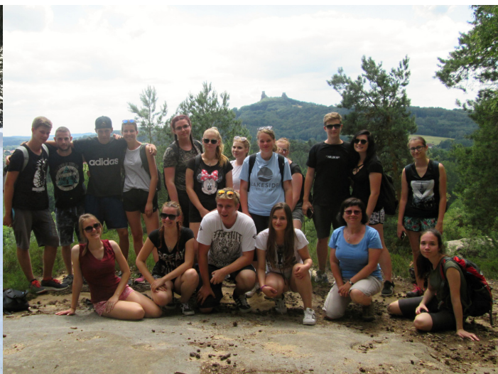
Obrázek č. 4: Turistický kurz třídy O3