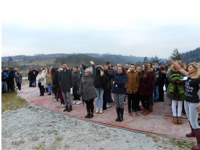
Obrázek č. 20: Cvičná evakuace, projektový den OČMU