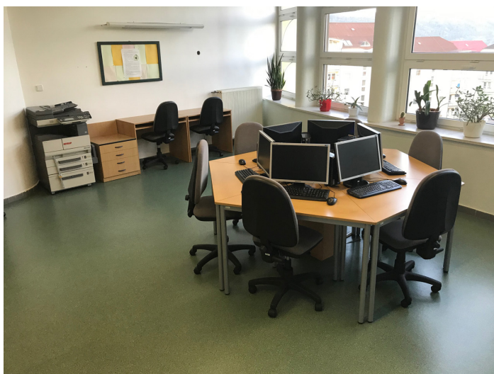
Obrázek č. 10: studentské informační centrum