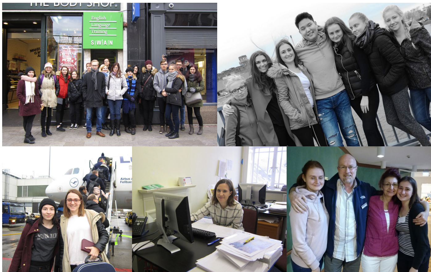
Obrázek č. 12, 13, 14, 15 a 16: Zahraniční stáž v Dublinu